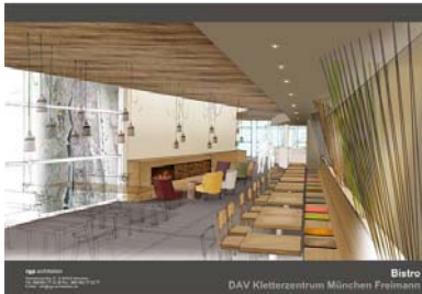
Modern: der geplante Bistrobereich.

Neben einem Klettershop erwartet die Besucher ein Bistrobereich mit einer Dachterrasse, von der aus man einen wunderschönen Blick auf die Freianlage und die Allianz-Arena hat.