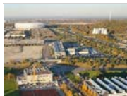
Eröffnung 2015: Die Kletteranlage in Freimann, im Hintergrund eine andere, nicht ganz unbekannt Münchner Sportstätte.

Wenn die Arbeiten April 2015 voraussichtlich abgeschlossen sein werden, entsteht nahe der Allianz-Arena eine der modernsten Anlagen weltweit. Auf die Kletterer wartet dann nicht nur eine Wettkampfarena im Freigeände für über 2.000 Zuschauer, sondern eine große Boulderhalle und einige tausend Quadratmeter Kletterspaß für die Freunde des Seilkletterns. Die Kletter- und Boulderflächen belaufen sich im ersten Bauabschnitt auf insgesamt rund 3.800 qm.