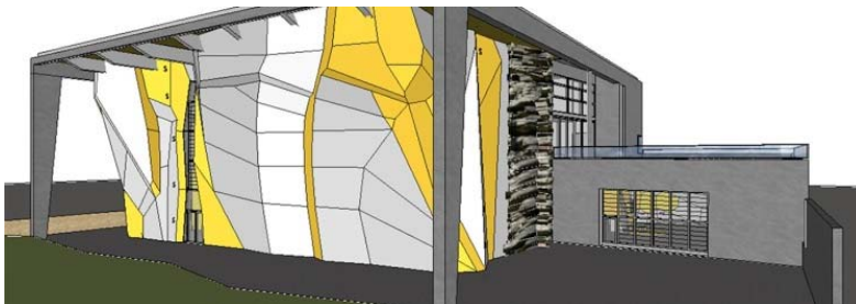
( http://cdn.kletterszene.com/images/2014/11/KBF3.jpg )