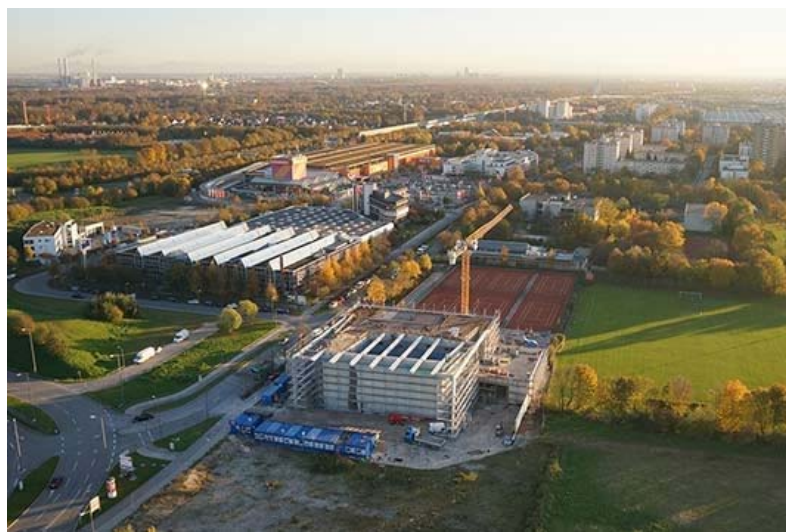
Die Kletterlandschaft in München wird erweitert