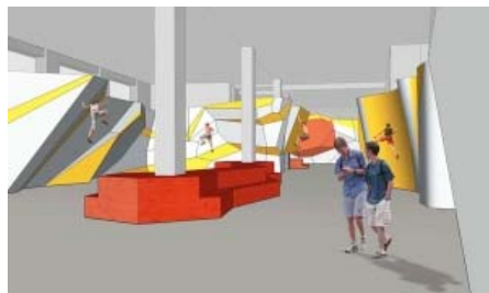
Hier wird bald gebouldert, Bild: DAV Kletter- und Boulderzentren München e.V.

Grundfläche Klettern indoor: 500 qm Grundfläche Bouldern indoor: 800 qm Wandhöhe Klettern: 15 m