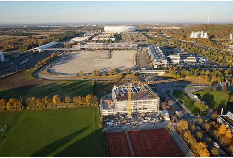
Von der Dachterrasse hat man die Allianz-Arena im Blick, Foto: DAV Kletter- und Boulderzentren München e.V.